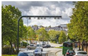
Bompengesubsidier og folkeavstemming