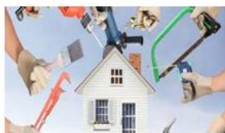
Vedlikehold av kommunale boliger