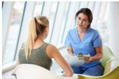
Helsesøstre og miljøarbeidere i skolen